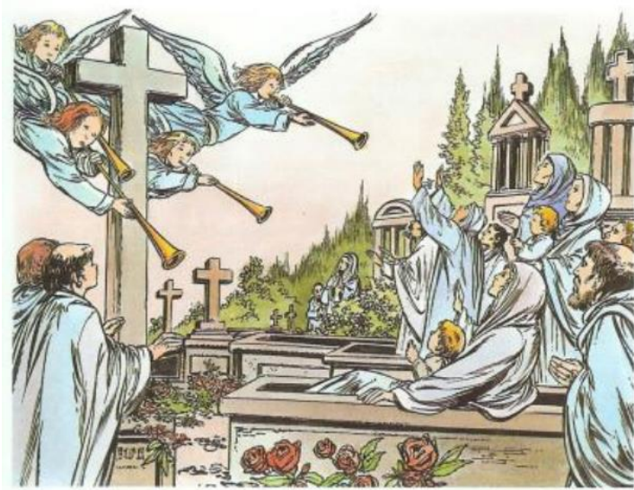
CONMEMORACIÓN DE LOS FIELES DIFUNTOS

Душ, которые не благодарны и, хотя и находятся в плену в такой ужасной тюрьме, получают для нас прекрасные милости от Бога и будут еще более благодарны впоследствии, когда они, наконец, достигнут Рая.